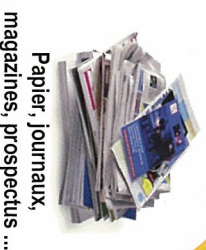
Papier, journaux, magazines, prospectus ...