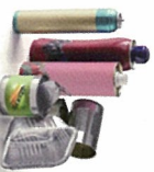
Aérosols, barquettes alu, canettes, conserves ...

En vrac dans le bac, sans sac, bouteilles vidées avec ou sans bouchons. Pas d'enveloppants (films) en plastique, ni polystyrène