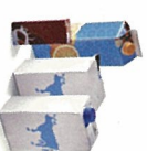
Briques alimentaires vides avec bouchons