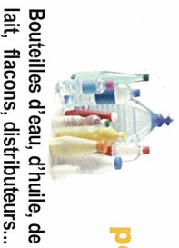
Bouteilles d'eau, d'huile, de lait, flacons, distributeurs...