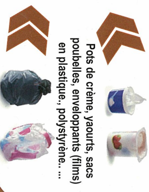
Pots de crème, yaourts, sacs poubelles, enveloppants (films) en plastique, polystyrène... ..